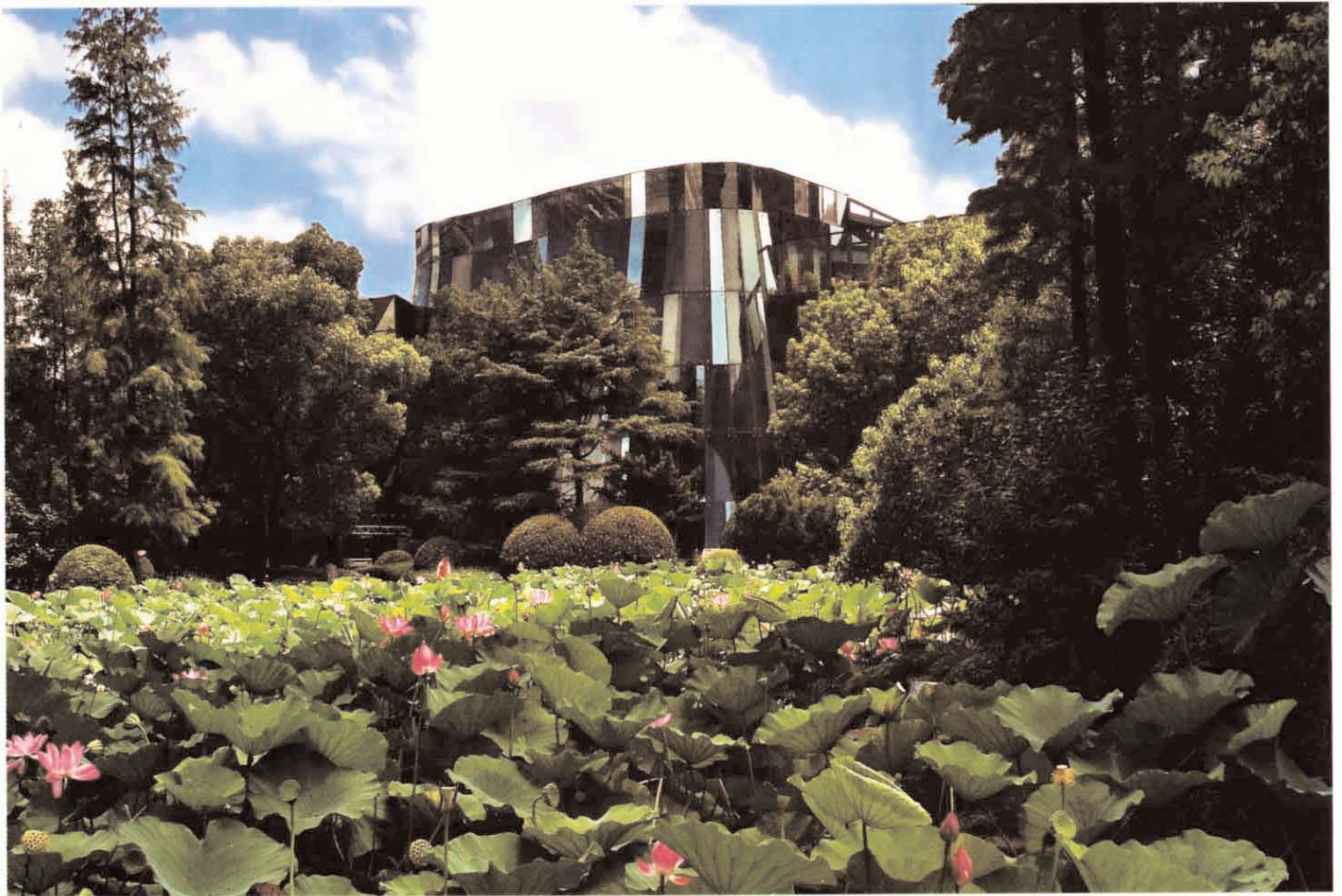
Ci-dessus: dessinées par Liu Yuyang, les facettes du MoCA diffractent le ciel au cœur de son jardin paysager. Ci-contre: les films colorés qui strient les vitrages du Nanjing Lu Bar découpent la vue panoramique sur Shanghai.