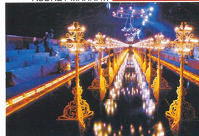
DE ARRIBA A ABAJO, LOS DESFILES DE JOHN GALLIANO Y VICTORIA'S SECRET.